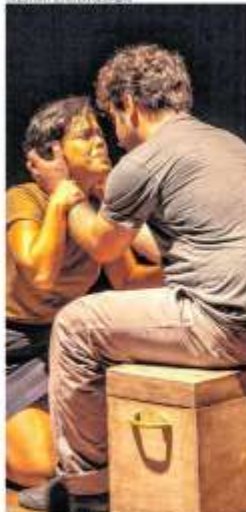
Espectáculo "O Ano que não acabou", do Grupo Expressões Humanas