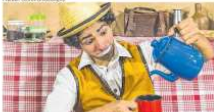
Dia Mundial do Teatro e o Dia Nacional do Circo. "Cidadãos Nordestinos", da Cia. Lagos Circo